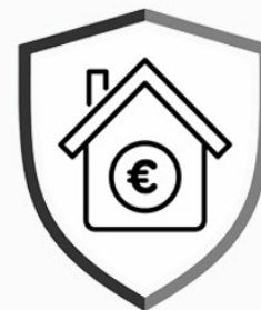
RAHOITUS JA ARVONNOUS