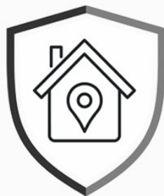
TONTIT, UUDET KOHTEET JA ETUOSTO-OIKEUS