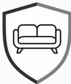
STAILAUS- JA SISUSTUSRATKAISUT